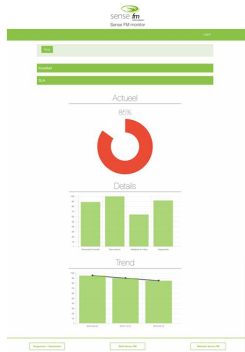
Voorbeeld Sense FM Monitor – niveau 3